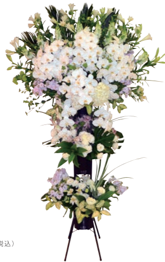
30 生花 絆 [きずな] 55,000 円(税込)