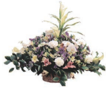
25 アレンジフラワー 8,800 円(税込)