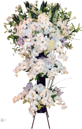
31 生花 永遠 [えいえん] 110,000 円(税込)