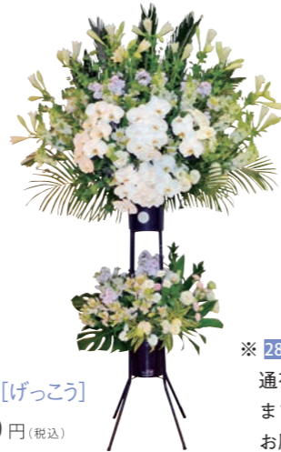
29 生花 月光[げっこう] 38,500 円(税込)