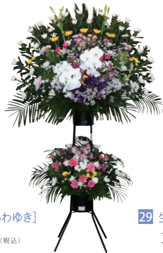
28 生花 淡雪[あわゆき] 27,500 円(税込)