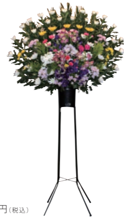
26 生花一段 16,500 円(税込)